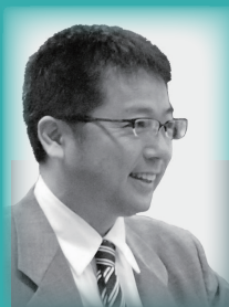
講師：吉田素文 教授 (国際医療福祉大学)

http://www.icer.kyushu-u.ac.jp/topics_20180125